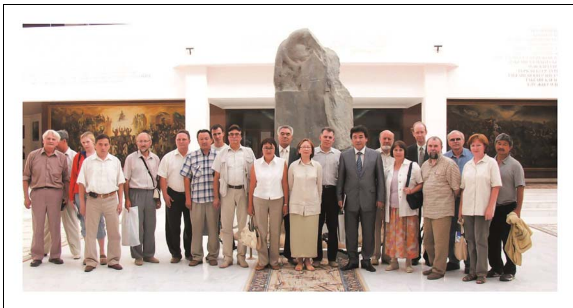
Рис. 3. Участники полевого семинара, 2004 г.