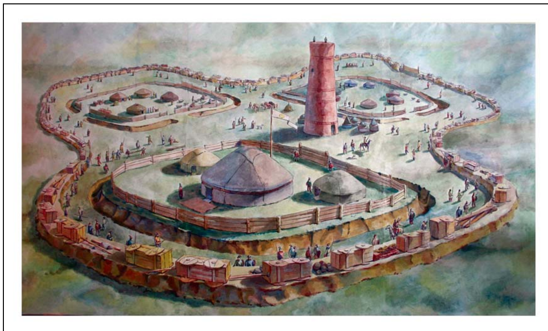
Рис. 2. Реконструкция городища Бозок. Автор К.А. Акишев.