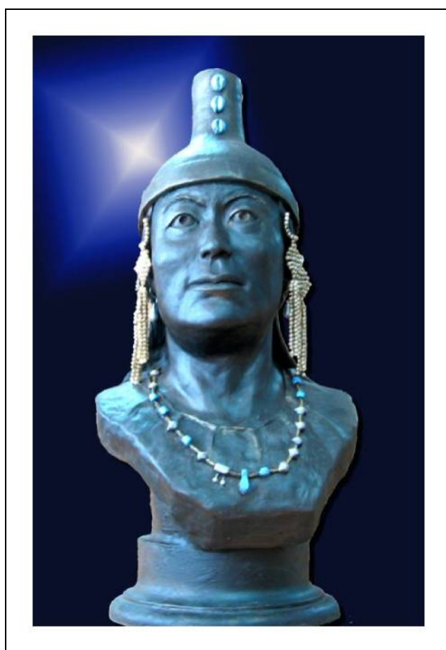
Рис. 4. Реконструкция по черепу. Автор Т.С. Балуева.